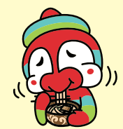
本部町観光大使がトモー